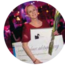
Arbetsgivarorganisationen får "Årets innovation" 2013.

2017. Avtalsrörelsen 2017 startar formellt i december 2016. Knappt ett år senare, efter omfattande förhandlingar, förlängningar samt medling, har treårigt kollektivavtal tecknats med samtliga arbetstagarorganisationer. Några förändringar: Löneökning om 6,5 procent över tre år samt förenklade arbetstidsregler för präst och kyrkomusiker.